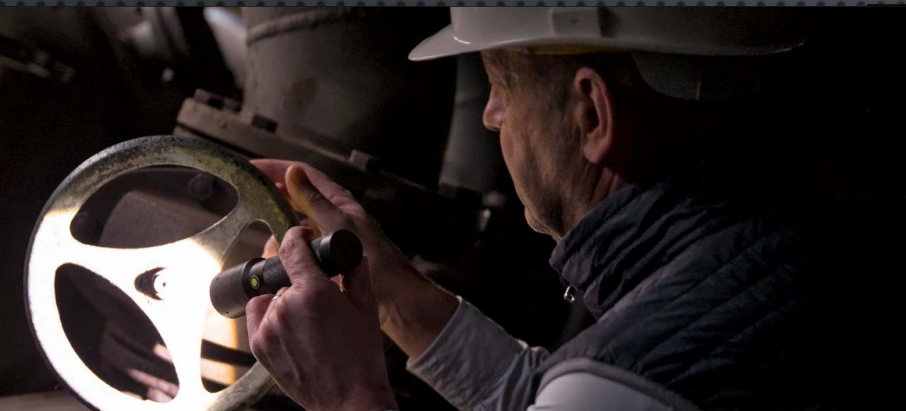
Ledlenser P2 AFS