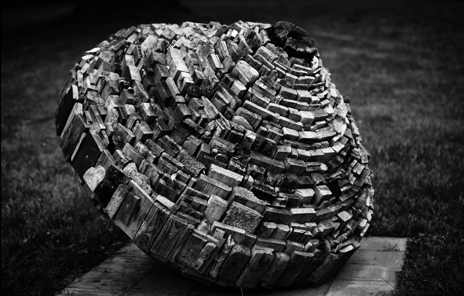
5 Affotografering af kunstværk Beskær tæt på 14