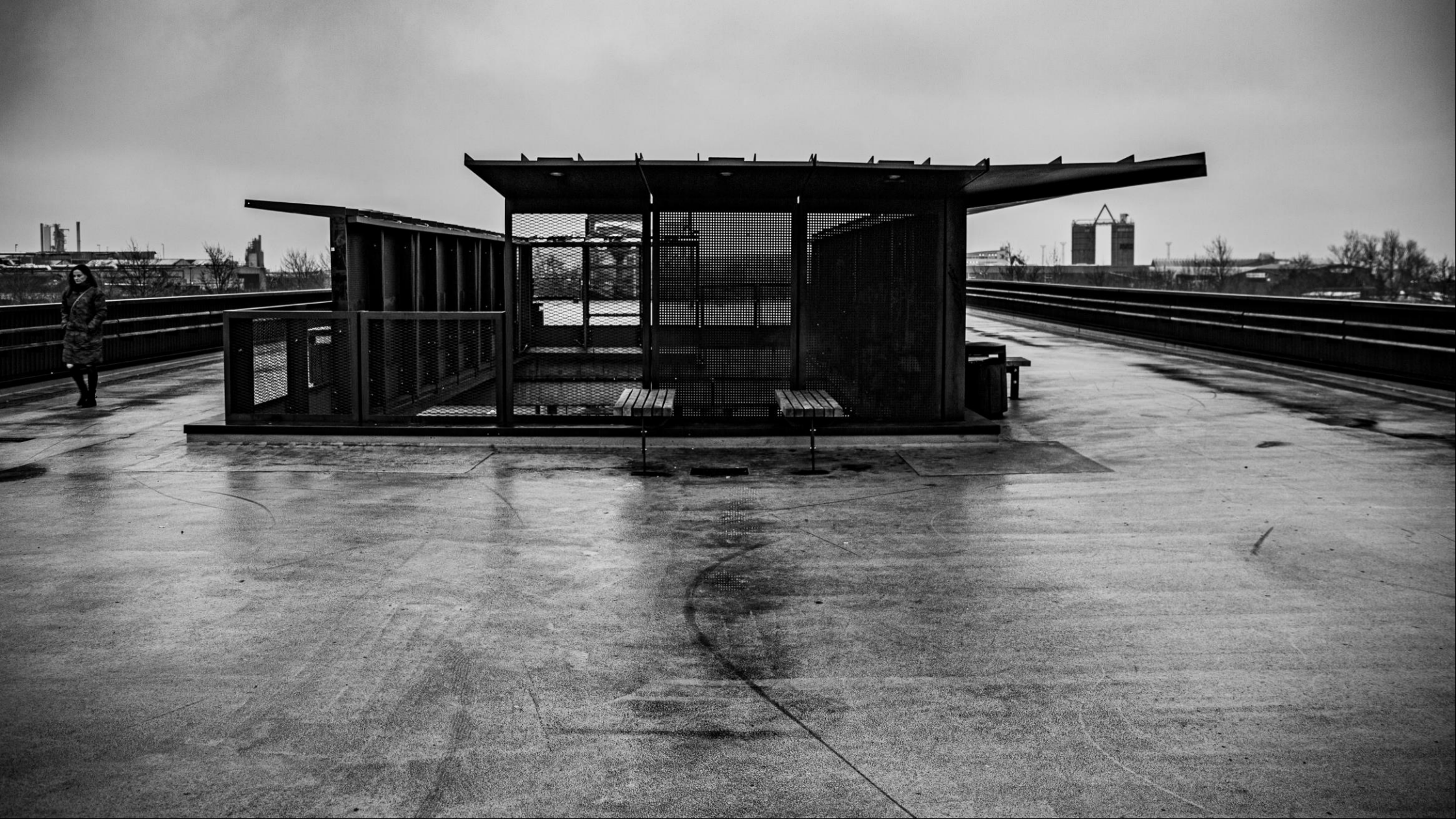
8 Fin SH konvertering Beskæres i bunden Pigen forkert placeret 12