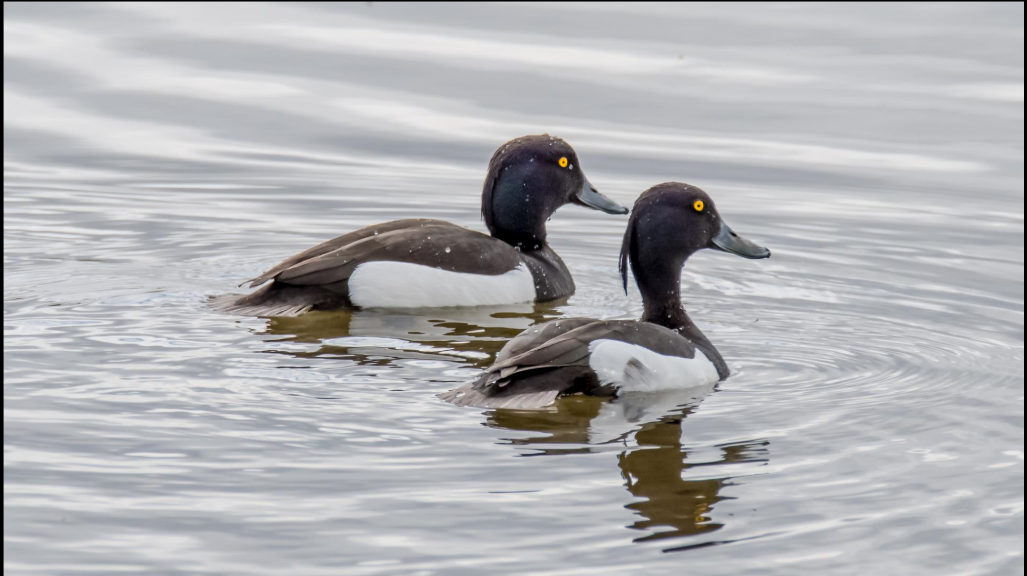
4 Placeret midt i billedet. Beskær venstre side, Mere kontrast, Mal de mørke striber frem i vandet, Registrering af 2 fugle 17